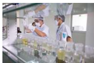
■ 实创科技质检中心