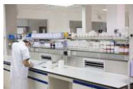
■ 实创科技研发中心

“科技演绎完美，实力创造奇迹”！实创将秉承新时代的工匠精神，不断创新成长，强化企业文化与团队建设，努力成为客户最值得信赖的长期合作伙伴。