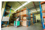
■ 实创科技成品仓库