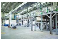
■ 实创科技生产车间