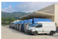
■ 实创科技运输车队