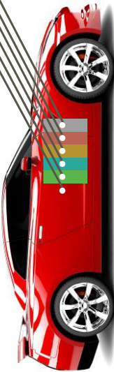
汽车车身修补涂层结构示意图