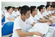
■ 实创科技员工培训中心